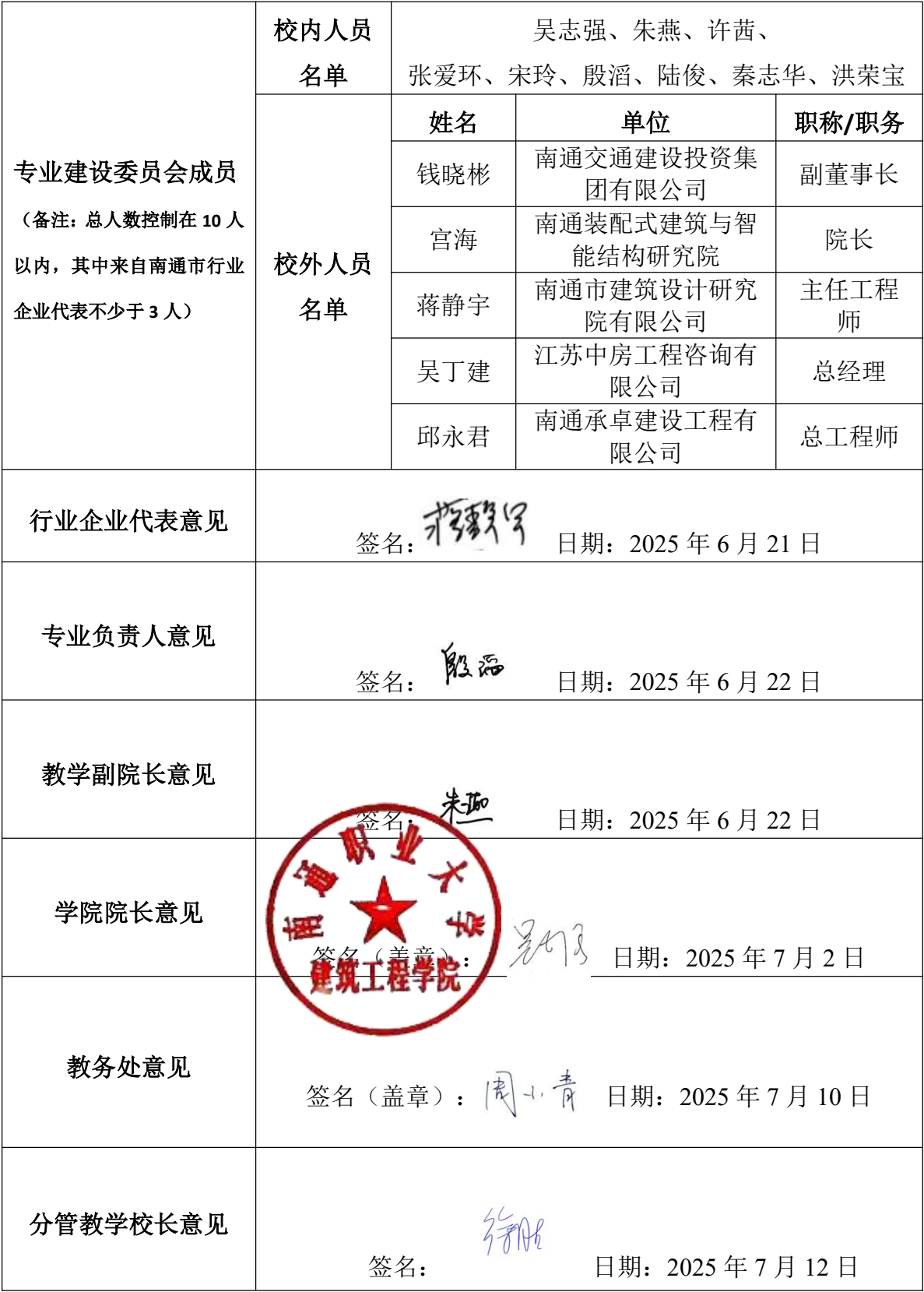
人才培养方案审批表